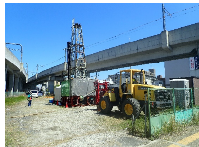
ボーリング孔によるVSP調査